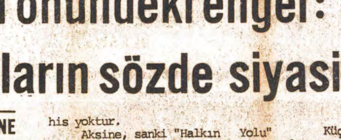
1971 öncesinden sonra ülkenin devrimci hareketi gelişti. Dünya kapitalizminin genel bunalmışa bağlı olarak ülkenin devrimci hareketi gelişti. Dünya kapitalizminin genel bunalmışa bağlı olarak ülkenin devrimci hareketi gelişti.