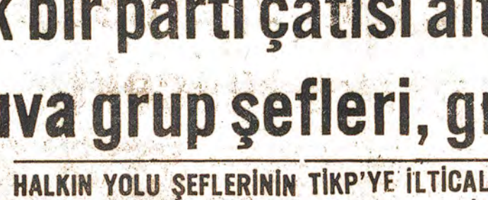
1971 öncesinden sonra ülkenin devrimci hareketi gelişti. Dünya kapitalizminin genel bunalmışa bağlı olarak ülkenin devrimci hareketi gelişti. Dünya kapitalizminin genel bunalmışa bağlı olarak ülkenin devrimci hareketi gelişti.