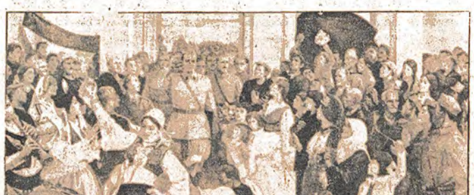
11 Ocak 1946 Cumhuriyetin ilan gününe adanmış bir resim: "Cumhuriyetin İlanı"

Özellik ve nitelikleri geliştiren topluluğumuz ve gruplar, her yandan kombinanın geniş işçi kitlesinin sanat yeteneklerini geliştiriyor ve geliştiriyor. Her yıl, devrimci hareketin ideolojik ve estetik ihtiyaçlarına katkıda bulunuluyor. Bu işlevleri, kombine, fabrikalar, tarım kooperatiflerinde, ilköğretim ve ortaokullarda ve kulüplerde gerçekleştiriliyor.