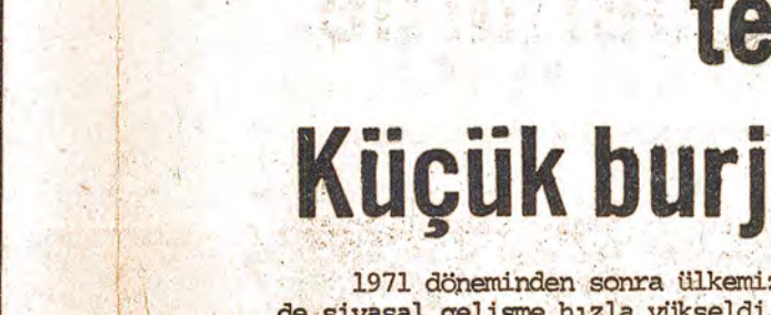
1971 öncesinden sonra ülkenin devrimci hareketi gelişti. Dünya kapitalizminin genel bunalmışa bağlı olarak ülkenin devrimci hareketi gelişti. Dünya kapitalizminin genel bunalmışa bağlı olarak ülkenin devrimci hareketi gelişti.