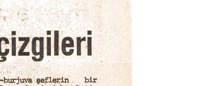
1971 öncesinden sonra ülkenin devrimci hareketi gelişti. Dünya kapitalizminin genel bunalmışa bağlı olarak ülkenin devrimci hareketi gelişti. Dünya kapitalizminin genel bunalmışa bağlı olarak ülkenin devrimci hareketi gelişti.