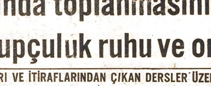
1971 öncesinden sonra ülkenin devrimci hareketi gelişti. Dünya kapitalizminin genel bunalmışa bağlı olarak ülkenin devrimci hareketi gelişti. Dünya kapitalizminin genel bunalmışa bağlı olarak ülkenin devrimci hareketi gelişti.